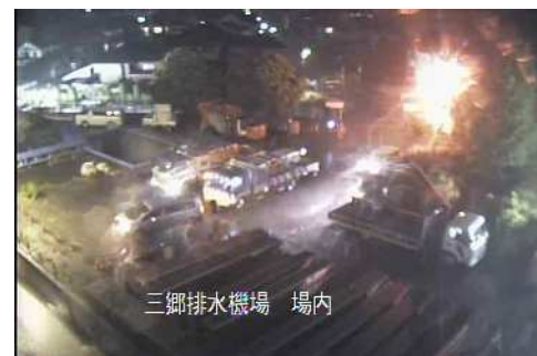
排水準備中の排水ポンプ車

<発表記者クラブ> 竹芝記者クラブ 神奈川建設記者会 茨城県政記者クラブ 埼玉県政記者クラブ 千葉県政記者会 都庁記者クラブ