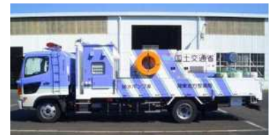
現地配備する排水ポンプ車

<発表記者クラブ> 竹芝記者クラブ 神奈川建設記者会 茨城県政記者クラブ 埼玉県政記者クラブ 千葉県政記者会 都庁記者クラブ