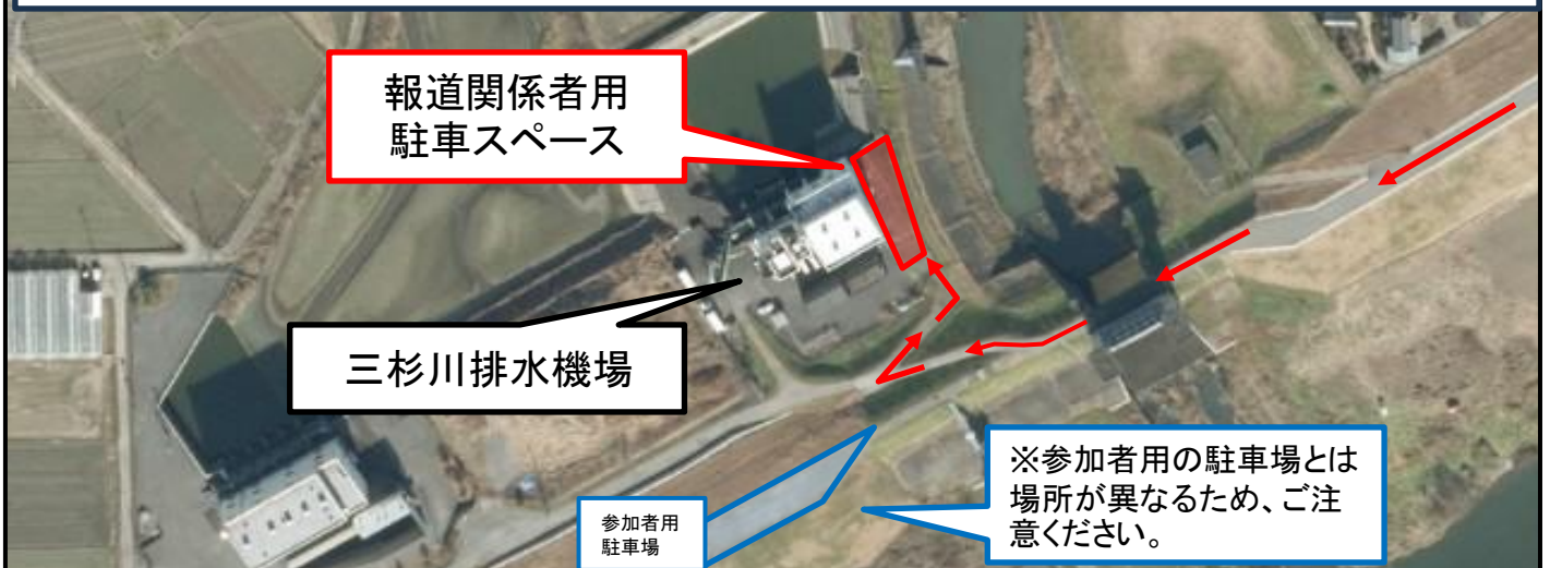
国土地理院ホームページ ( https://maps.gsi.go.jp/#18/36.274794/139.614730 ) を基に渡良瀬川河川事務所作成