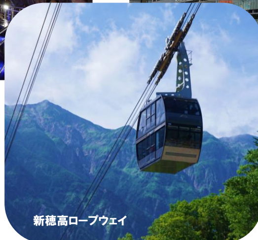
新徳高ロープウェイ