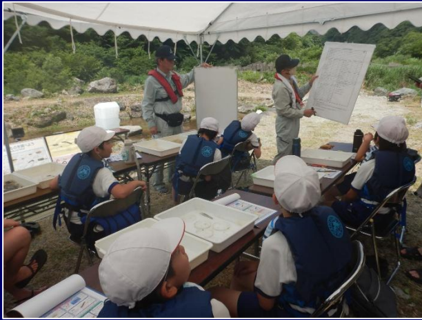
水生生物による水質調査