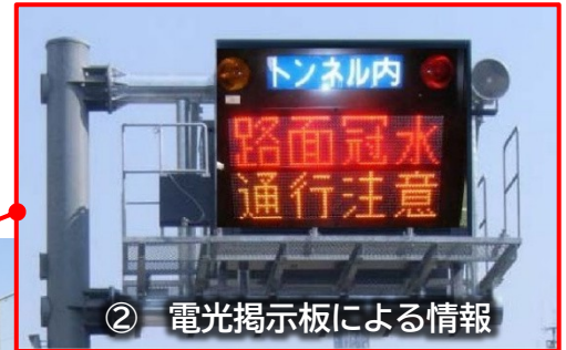
② 電光掲示板による情報