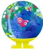
2027年国際園芸博覧会 公式マスコットキャラクター トウククトウンク