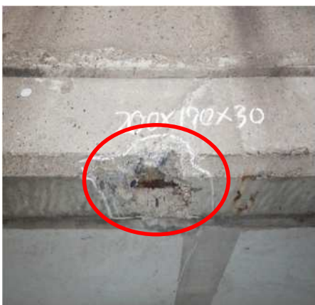
小山高架橋(内廻り)：断面修復工