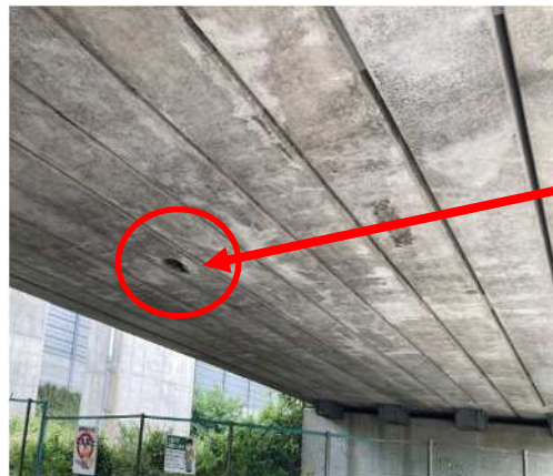
小山高架橋(内廻り)：剥落防止工