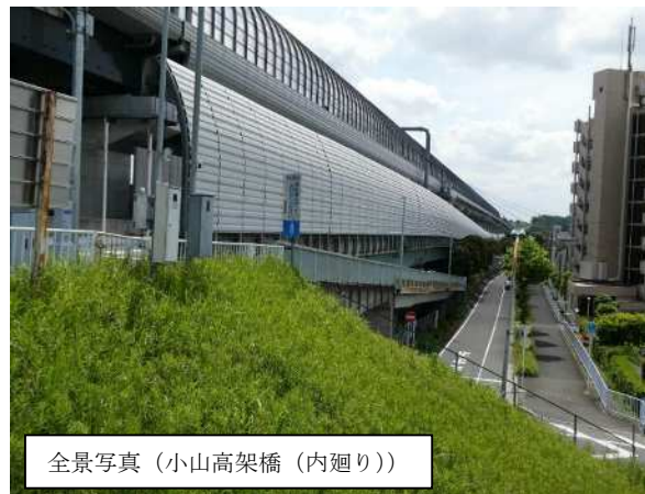
全景写真(小山高架橋(内廻り))