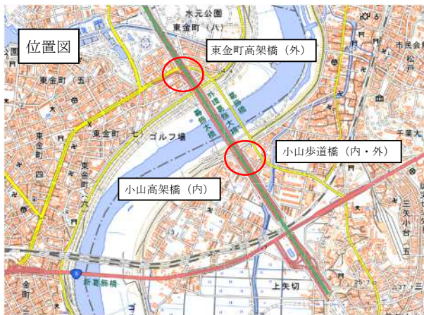
※地理院地図を加工して使用