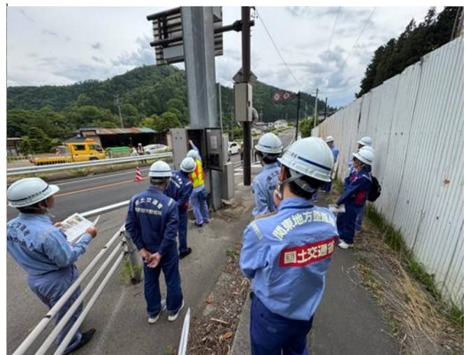
職員が大雨災害に備え遮断機の操作方法を確認（昨年度訓練の実施状況）