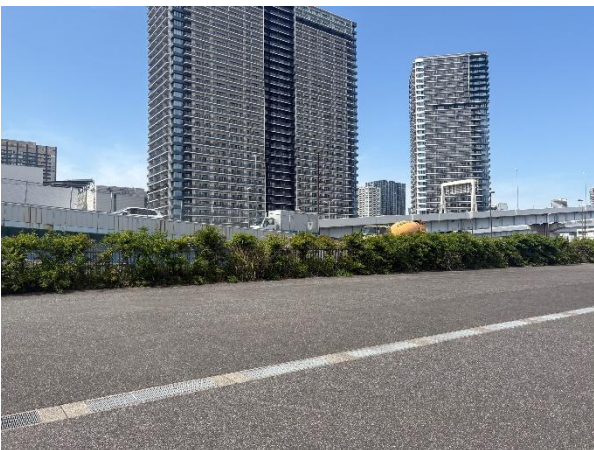
現場事務所設置場所