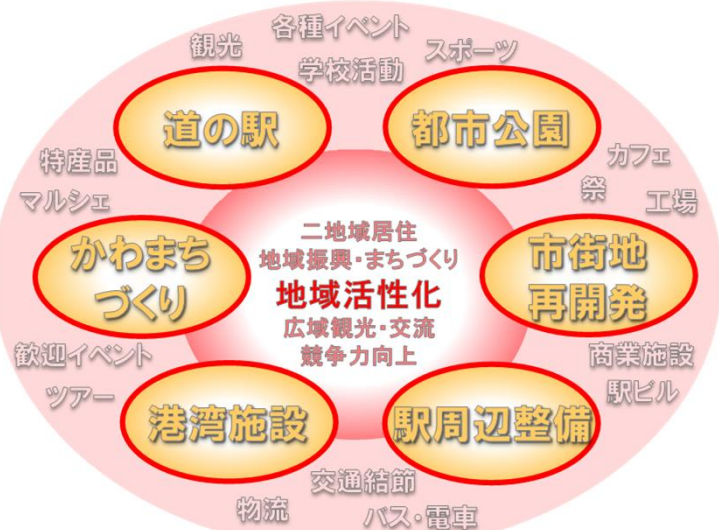
— イメージ —