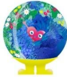
2027年国際園芸博覧会 公式マスコットキャラクター トゥンクトゥンク