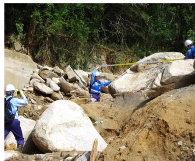
土砂災害被害状況の調査