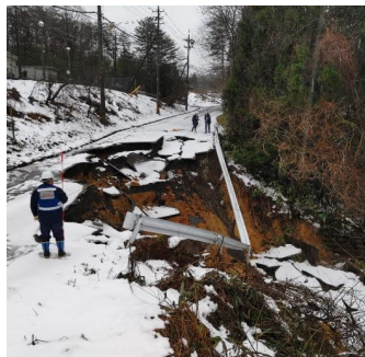
道路被害状況の調査