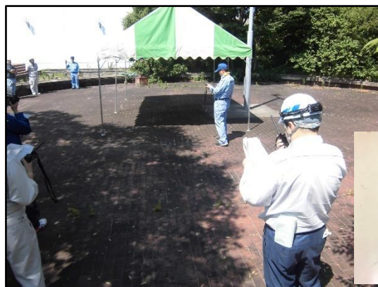
無線電話装置の使用説明