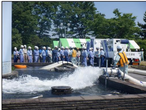
排水ポンプの操作