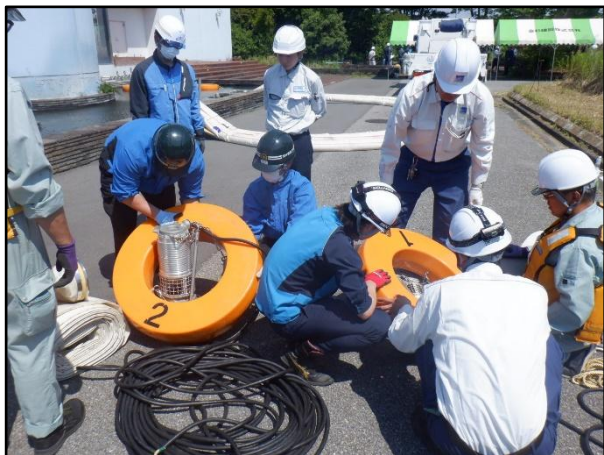
排水ポンプの組立