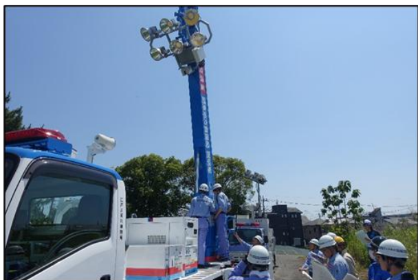
照明車伸縮装置の展開