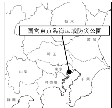
【事業予定箇所】 園内全体