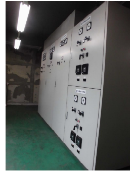
電気室（撤去対象のキュービクル）