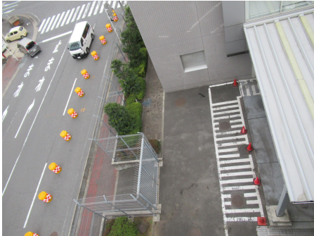
現場事務所設置場所