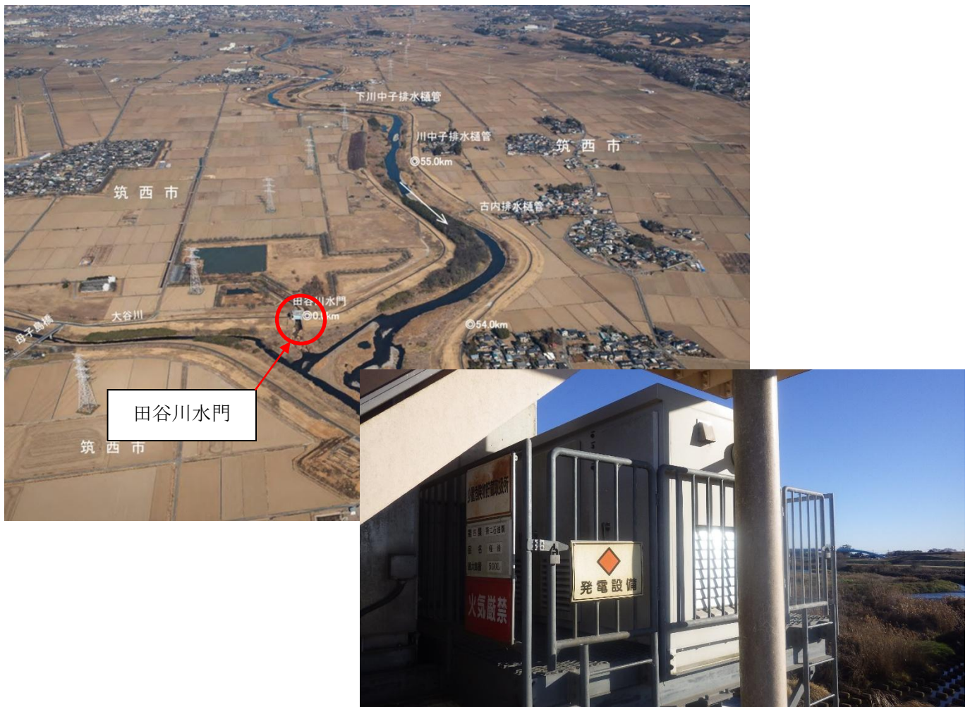
非常用発電設備（15kVA）更新