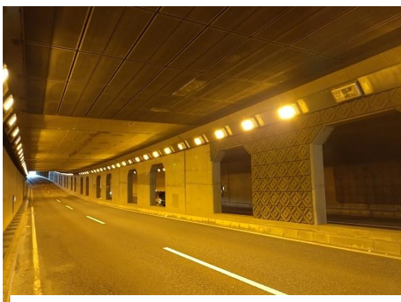
【小淵立体地下道内（地下道照明設備）】