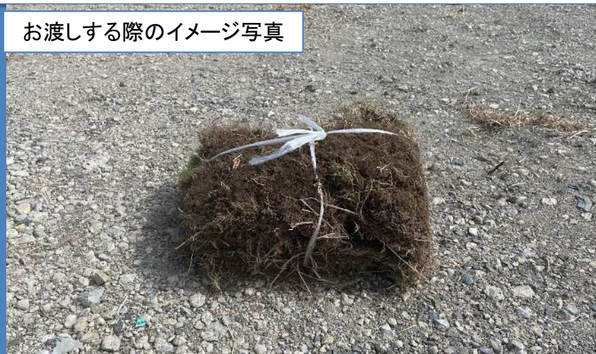
お渡しする際のイメージ写真