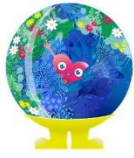
2027年国際園芸博覧会 公式マスコットキャラクター トゥンクトゥンク