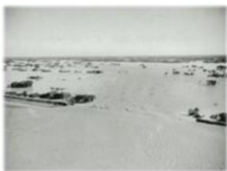
大利根町付近における堤防決壊状況

台風記憶と教訓を後世に語り継ぐため設立されたモニュメントがあり、水防の重要性を伝える役割を果たしています。