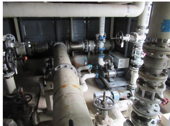
② 受水タンクポンプ室