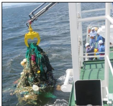
浮遊ゴミの回収作業