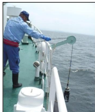
水質調査の実施状況