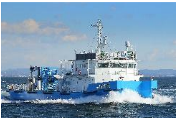
清掃兼油回収船「べいくりん」