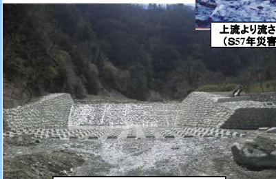
小武川下流床固群 施工完了箇所