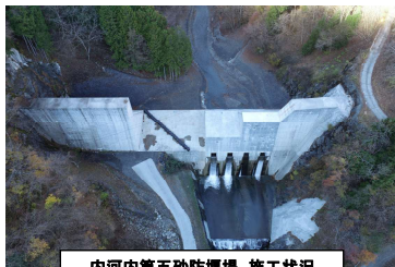
内河内第五砂防堰堤 施工状況