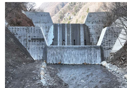
おしらがわさんこう 右岸砂防施設改築：空谷砂防堰堤