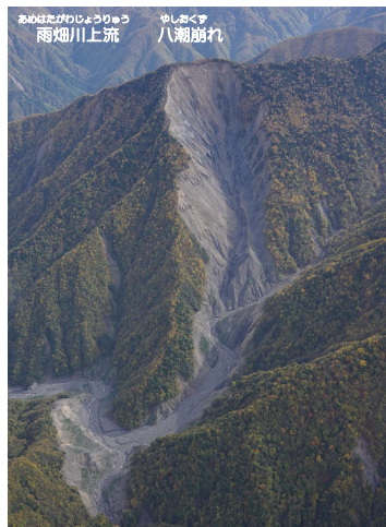
あめはたがわじょうりゅう 雨畑川上流