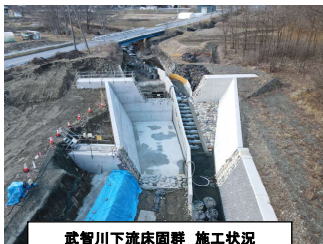
武智川下流床固群 施工状況