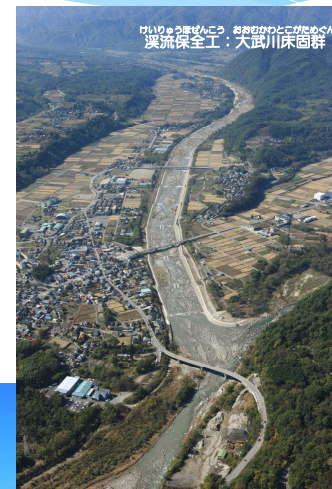
おしらがわさんこう 渓流保全工：大武川床固群