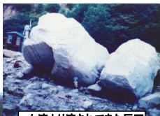
上流より流されてきた巨石 (S17年災害ドンドン沢)

床固群の整備により、川底や川岸を安定させることで、沿川集落の安全性を向上させます。