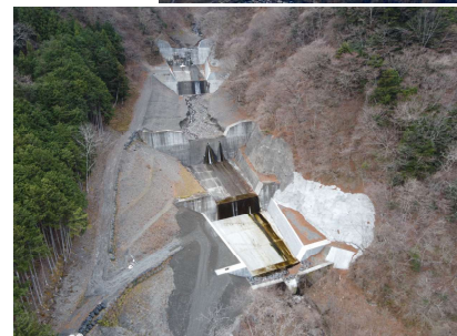
いけのさわきぼうえんてい 池の沢砂防堰堤群：第二砂防堰堤