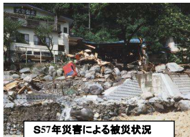
S17年災害による被災状況 (武智釜無川合流部)

床固群の整備により、川底や川岸を安定させることで、沿川集落の安全性を向上させます。