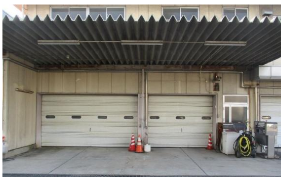
撤去箇所（シャッター改修）