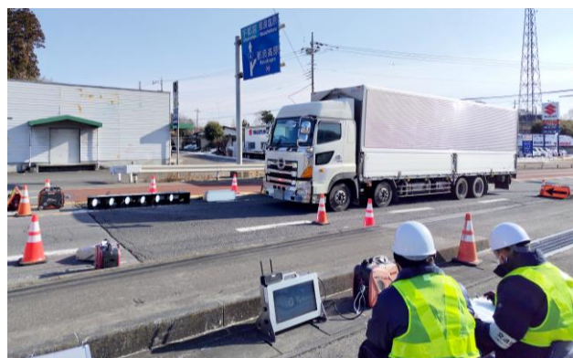
第2回冬用タイヤ装着率調査実施状況

ー冬用タイヤ自動判別システムー NETIS 登録番号 SK-190003-A https://www.w-e-shikoku.co.jp/wp-content/uploads/2021/07/wintertire_OL-1.pdf 西日本高速道路エンジニアリング 四国株式会社