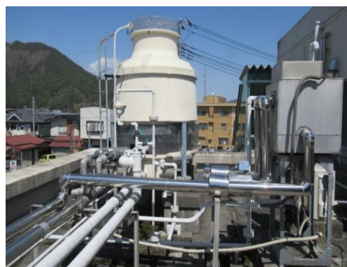
④冷却塔及び膨張タンク