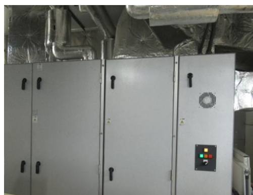
②コンパクト形空気調和機