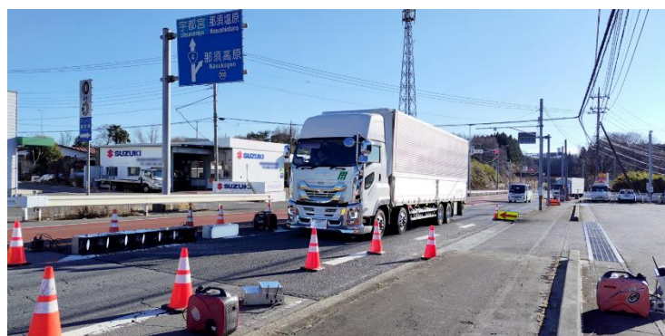
第1回冬用タイヤ装着率調査実施状況

ー冬用タイヤ自動判別システムー NETIS 登録番号 SK-190003-A https://www.w-e-shikoku.co.jp/wp-content/uploads/2021/07/wintertire_OL-1.pdf 西日本高速道路エンジニアリング 四国株式会社