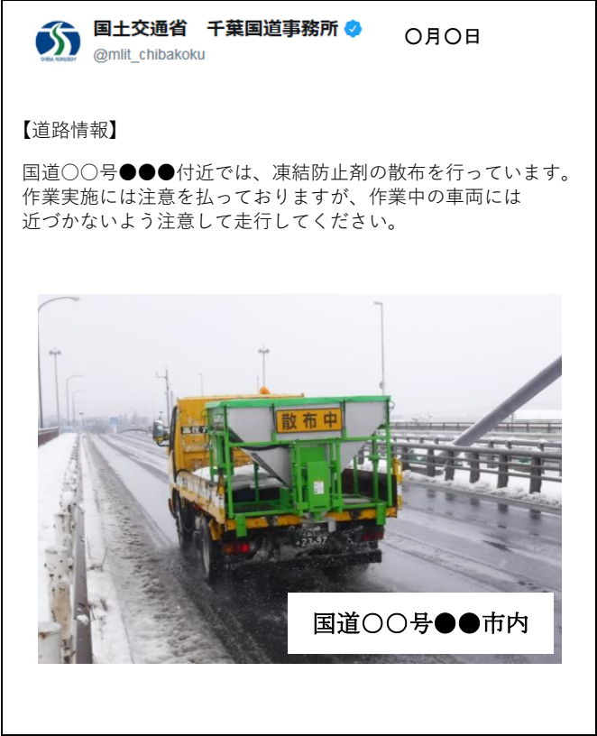
凍結防止剤散布車の作業に係る注意喚起