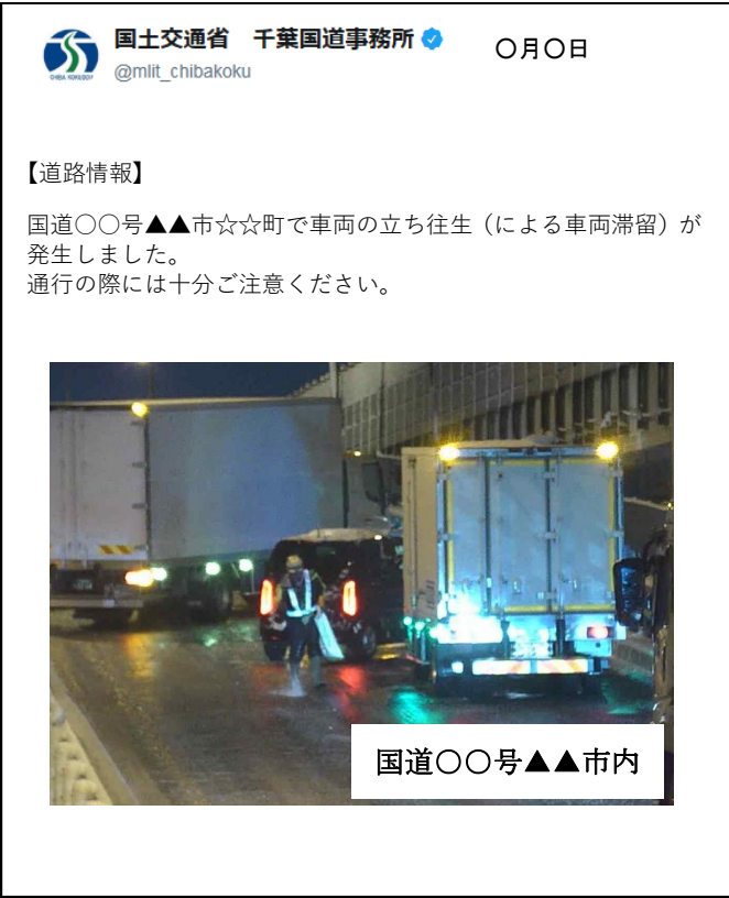
積雪時の道路状況を発信