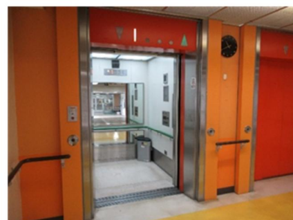
<エレベーター設備(6号機内部)>