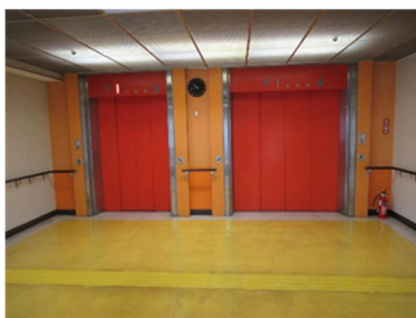
<エレベーター設備 (5号機(右)、6号機(左))>