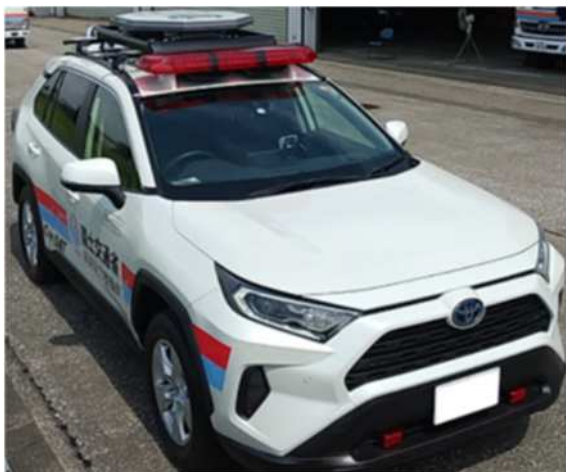
被災箇所をリアルタイムで映像配信 Car-SAT