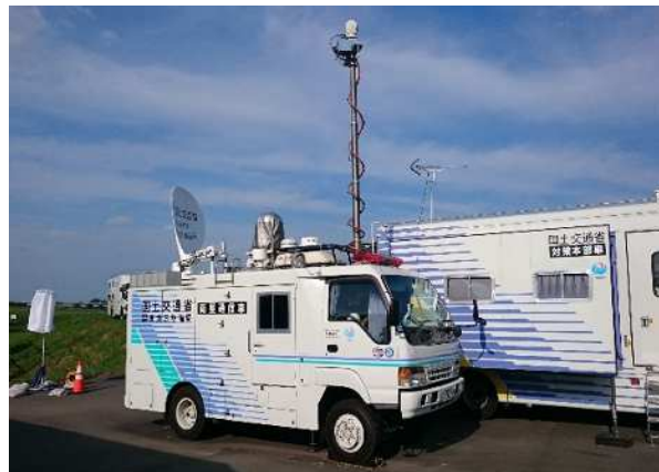
被災箇所をリアルタイムで映像配信 衛星通信車