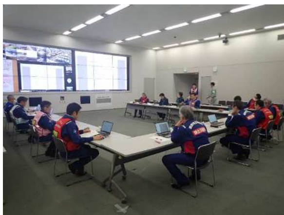
災害対策本部室等で配信映像を確認