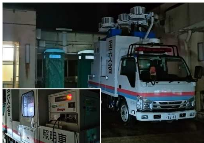
照明車からの電力供給により停電解消