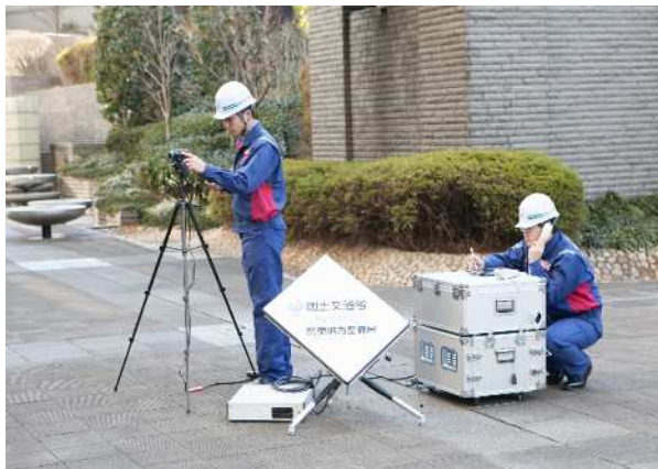
被災箇所をリアルタイムで映像配信 Ku-SAT