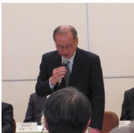
茨城県建設業協会会長