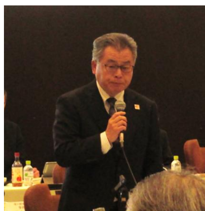
関東地方整備局長