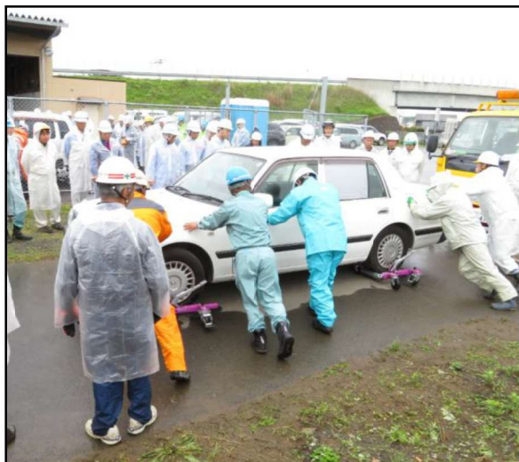
車両移動ジャッキ

大規模地震や大雪等の災害時には、被災地や被災地に向かう道路上に大量の放置車両や立ち往生車両が発生し、消防や救助活動の支障となります。このような事態に迅速に対応するため、平成26年11月14日に災害対策基本法の一部を改正する法律が成立し、道路管理者が自ら車両移動の措置を講ずることが可能になりました。