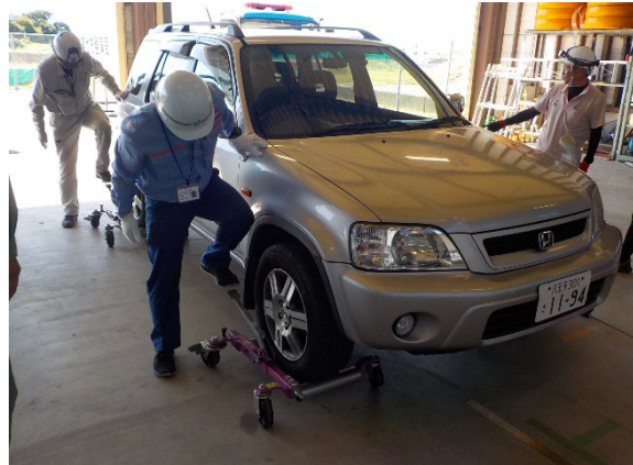
車両移動ジャッキ実施訓練