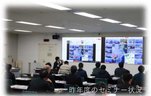
昨年度のセミナー状況