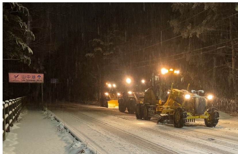
(令和6年2月29日 国道138号 山梨県山中湖村)