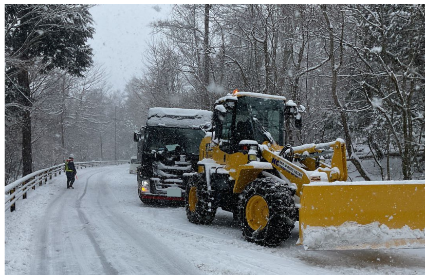
(令和6年2月5日 国道139号 山梨県鳴沢村)