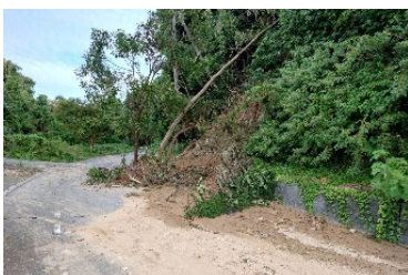
災害初期の被災状況把握