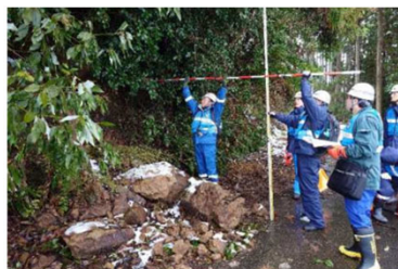
速やかな被災状況調査