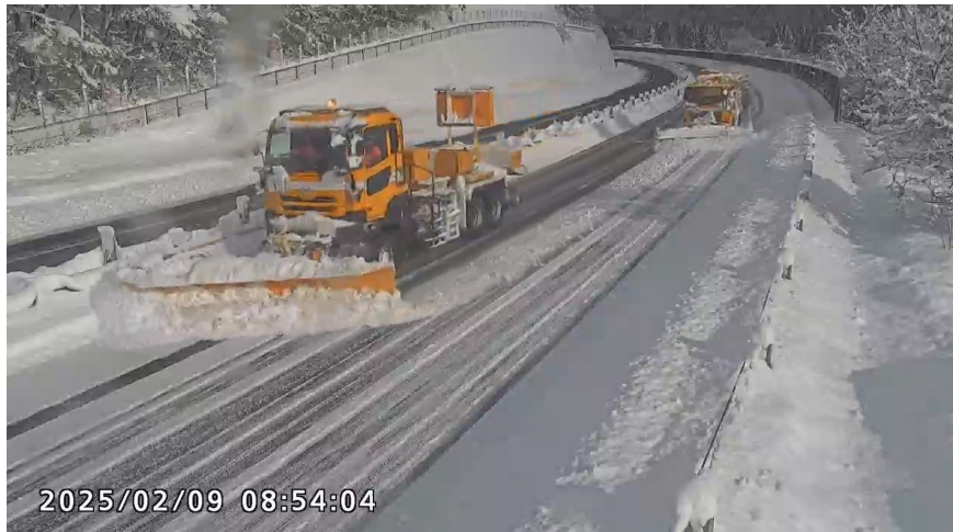
(令和7年2月 関越道 群馬県みなかみ町)