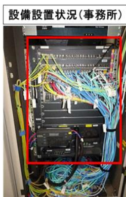
所内用L3-SW (モジュール型)