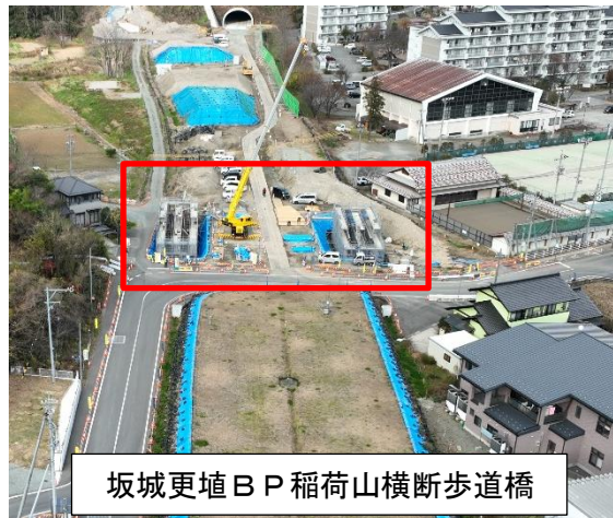
坂城更埴B P 稲荷山横断歩道橋