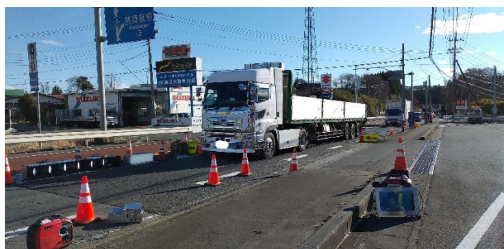
第1回冬用タイヤ装着率調査実施状況

ー冬用タイヤ自動判別システムー NETIS 登録番号 SK-190003-A https://www.w-e-shikoku.co.jp/wp-content/uploads/2021/07/wintertire_OL-1.pdf 西日本高速道路エンジニアリング 四国株式会社