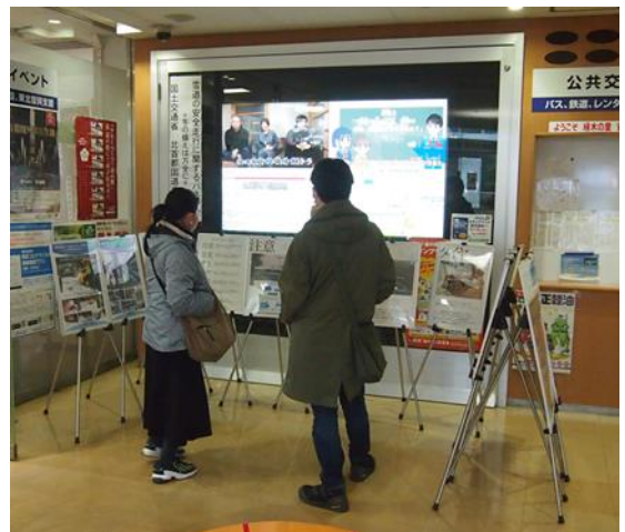
(写真は令和3年度開催の様子)