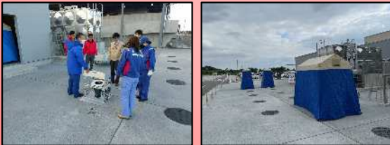
災害用トイレ設営訓練イメージ