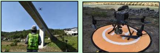
左：ドローン飛行イメージ 右：ドローン