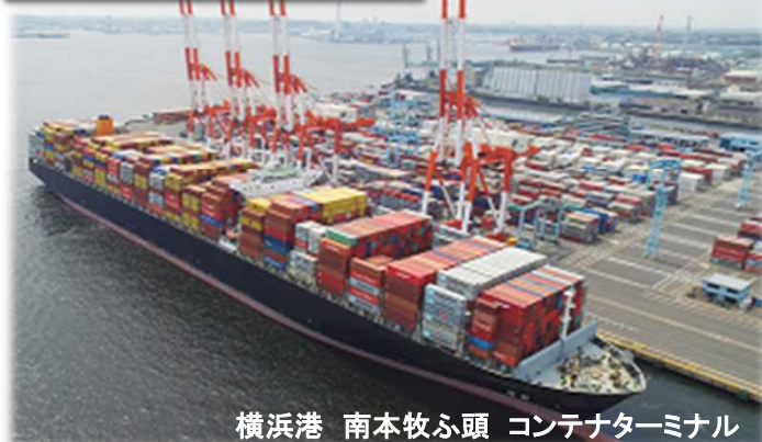
横浜港 南本牧ふ頭 コンテナターミナル