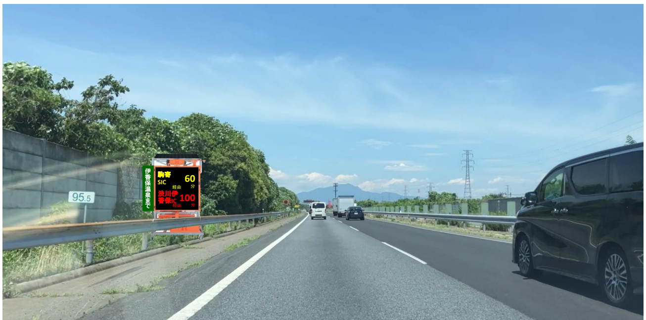
駒寄 SIC 手前約 3km 付近