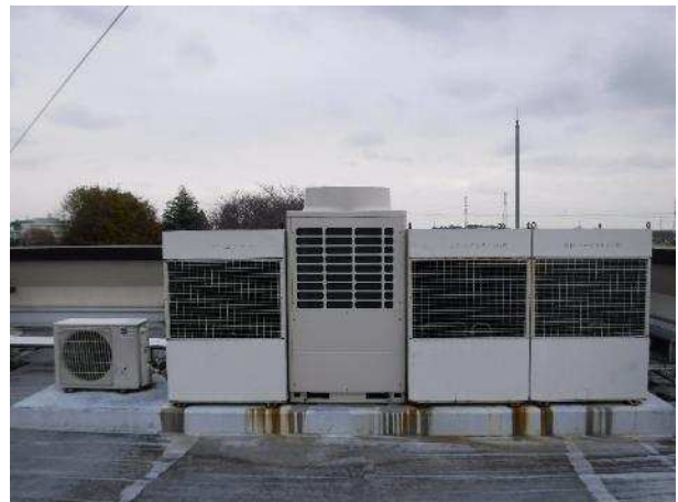
既設空調室外機（屋上）