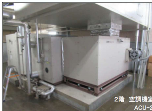
2階 空調機室 ACU-2