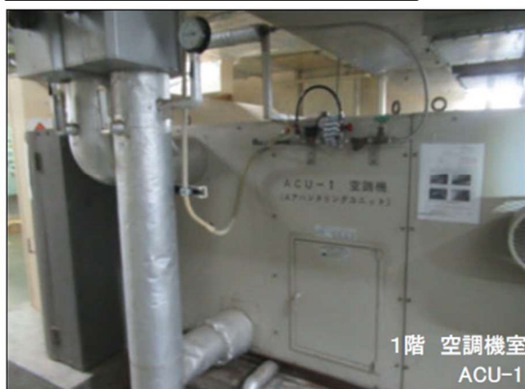
1階 空調機室 ACU-1