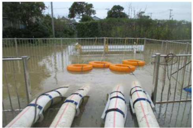
令和元年10月台風19号における神栖市内での排水ポンプ車による排水作業(令和元年10月)