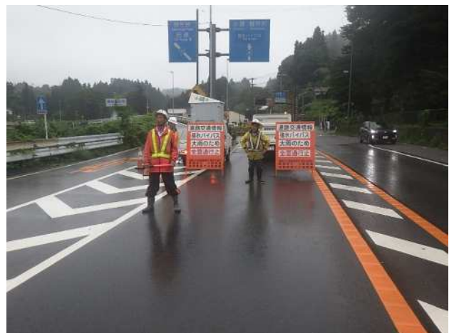
令和5年8月15日 豪雨時の通行止めの様子