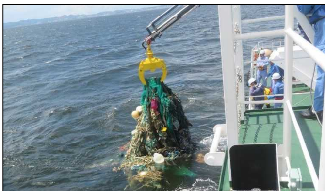
清掃兼油回収船「べいくりん」による浮遊ゴミの回収作業