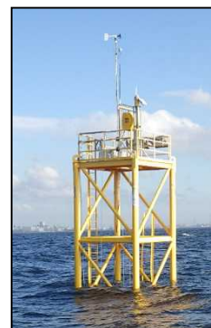
モニタリングポスト(検見川沖)