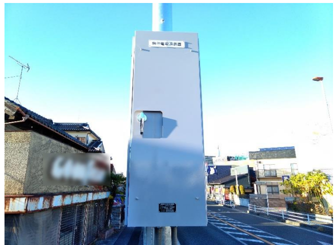
無停電電源装置（参考）