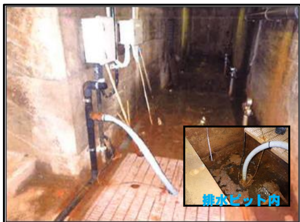
施工場所(下部監査廊)