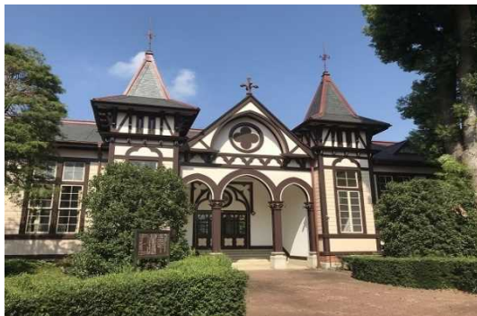
きゅういばら き けんりつ つちうらちゅうがっこうほんかん 旧茨城県立土浦中学校本館

本計画では、市内に残る歴史的な建造物の保存・活用に関する事業や、歴史や伝統文化を反映した活動の承継に関する事業、歴史的風致を活用した交流人口の拡大に関する事業、歴史的な建造物等の周遊環境の整備に関する事業等を位置づけ、歴史的風致の維持及び向上を図っていくこととしています。