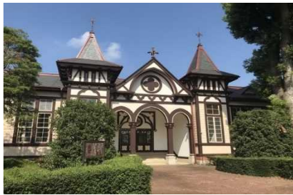
きゅういばら きけんりつつちうらちゅうがっこうほんかん 【土浦市】旧 茨城県立土浦中学校本館