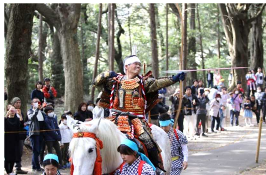
ひえじんじややぶさめまつり 日枝神社流鎧馬祭