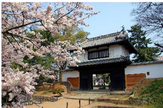
つちうらじょうし きじょうこうえん 土浦城址(亀城公園)