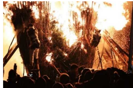
とば 【西尾市】鳥羽の火祭り