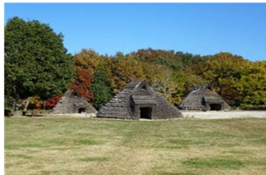
かみたか つ かいづか 上高津貝塚